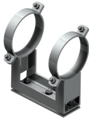
Typ 180 A